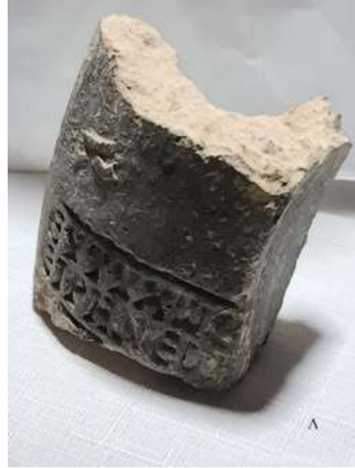
(لوحة ١ .٤)

الختم الذي يُقرأ: "أفتيخوس إيرينيوس"، أي "إيرينيوس السعيد"، © تصوير الباحث، ٢٠٢٣م.