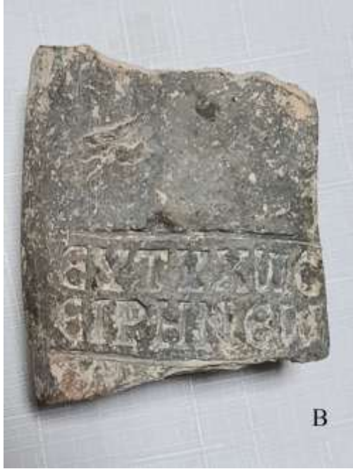
(لوحة ٢ .٤)

الختم الذي يُقرأ: "أفتيخوس إيرينيوس"، أي "إيرينيوس السعيد"، © تصوير الباحث، ٢٠٢٣م.