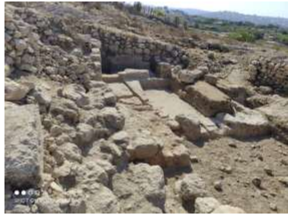
(لوحة ١ .٥)

منطقة الحفائر الإسرائيلية في خربة الطيبة، باتجاه الجنوب الشرقي، © تصوير الباحث، ٢٠٢٣م.