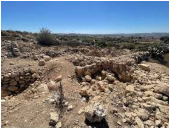
(لوحة ٢ .٥)

جزء من فوهة صحن فخاري عميق (Krater) مختوم على أعلى الفوهة المائلة للخارج، © تصوير الباحث ٢٠٢٣م.